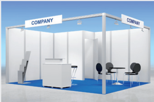
Musterskizze Komplettpaket · Specimen drawing Complete Package